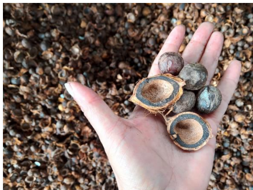
Resultado: Amêndoas de tucumã intactas

trazendo um resultado em pouco tempo de trabalho, e com isso a cooperativa pode se reorganizar e planejar a próxima safra.